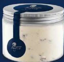
Mascarpone amb figues