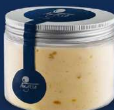
Ratafia amb nous