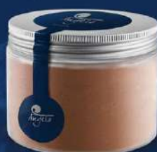
Xocolata 70 %