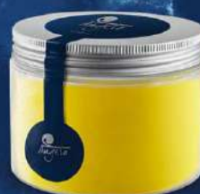
Sorbet de mango