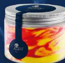
Sorbet de mango amb coulis de gerds