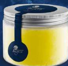
Sorbet de mandarina