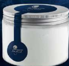
Crema de Coco (apte per a vegans)