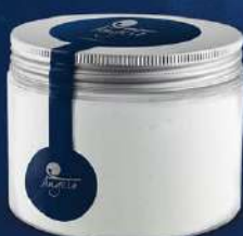
Sorbet de llimona